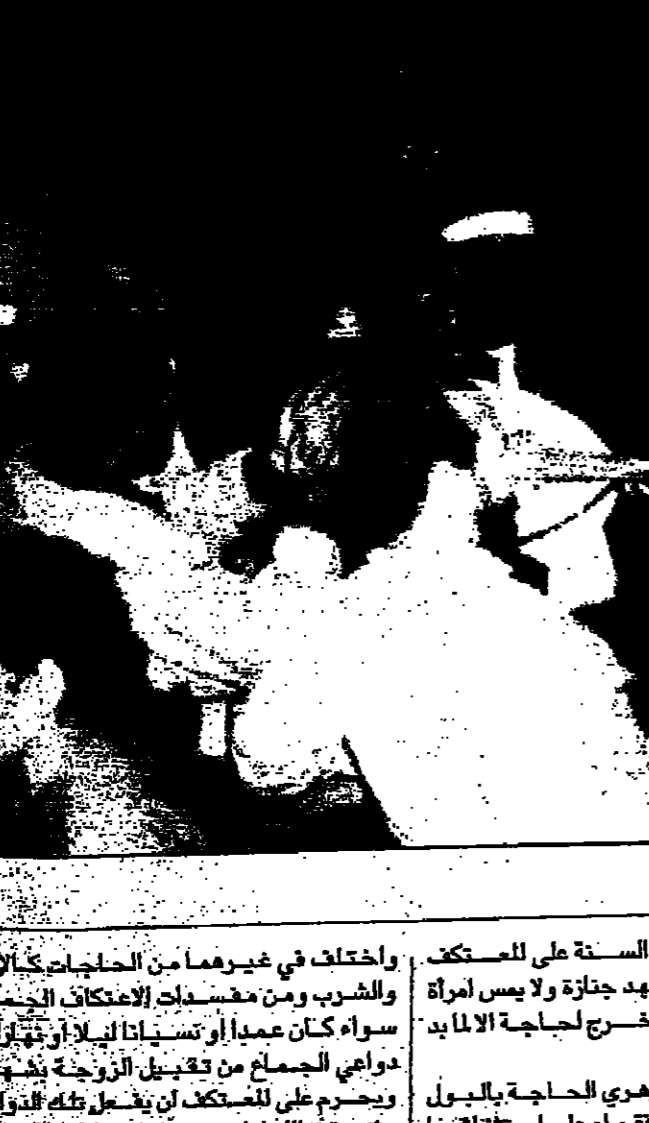
سهره رمضان في طرب شعبي في مقامي المصين